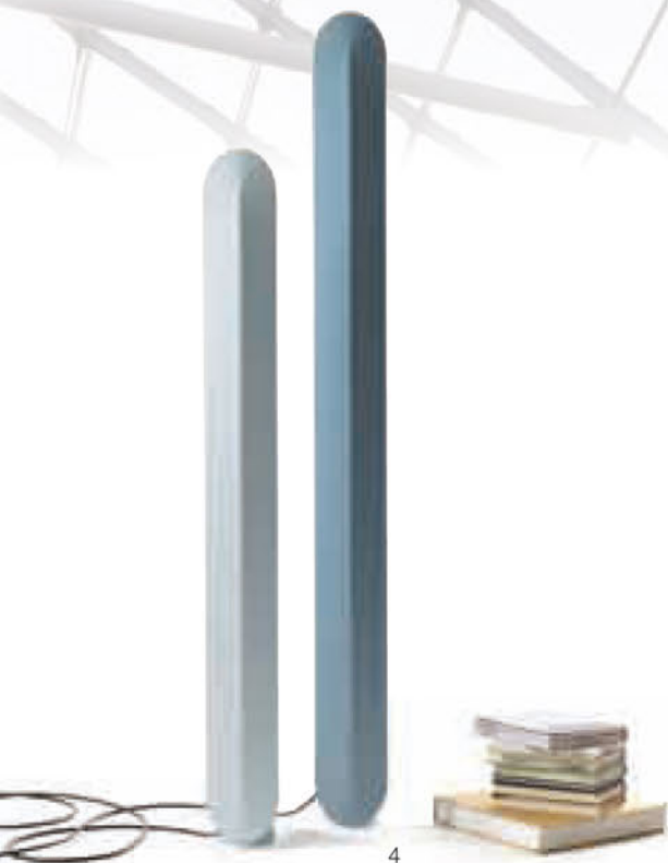
4. Pas de deux di Fresh From the Mint, design Sarah Böttger: lampade concepite come fonti di luce indirette con tutte le parti tecniche coperte da un involucro facilmente rimovibile; nessuna vite o giuntura risulta visibile dall'esterno. 5. Repeat di Fresh From the Mint, design Catherine Werdel: un tappeto componibile accostando singoli moduli che riprendono i contorni di un puzzle. "Repeat" può essere assemblato nelle dimensioni desiderate, grazie ai moduli espandibili all'infinito. 6. Megaphone di En&ls: amplificatore passivo in ceramica per iPhone. La forma è concepita per amplificare ed ottimizzare al meglio l'uscita del suono.