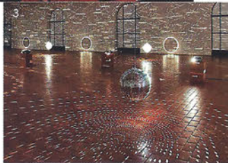
Kuva Edo Kuipers