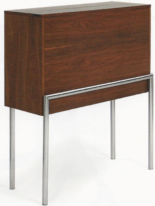
Produkt: ORCUS Hersteller: CLASSICON Designer: KONSTANTIN GRCIC Webcode: 05.102010052