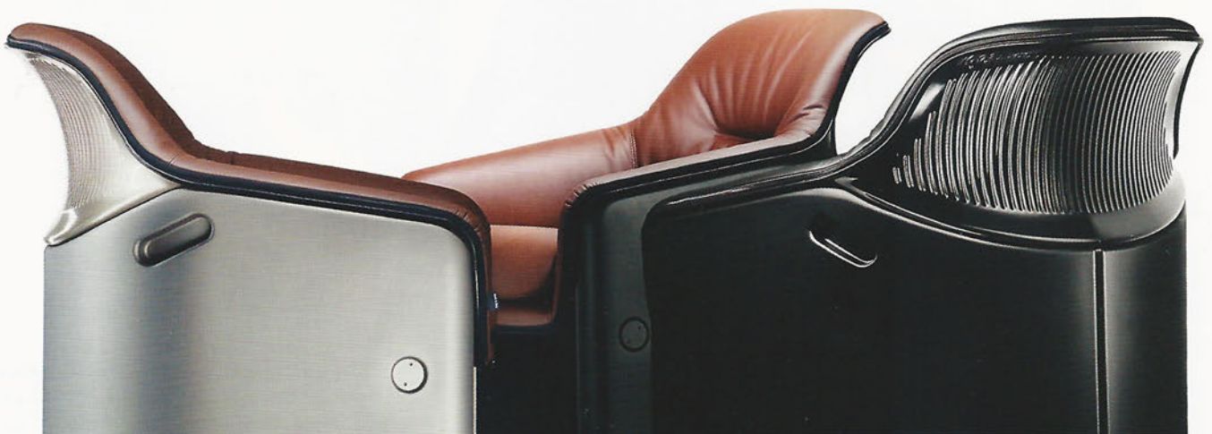
Produkt: AVUS Hersteller: PLANK Designer: KONSTANTIN GRCIC Webcode: 05.1423.00057